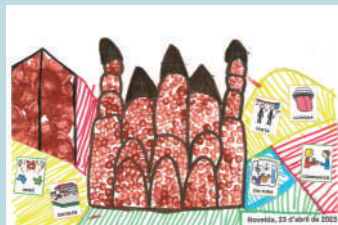
2n Premi Concurs de dibuix 2023 UECIL, CEIP Cervantes, de Monòver